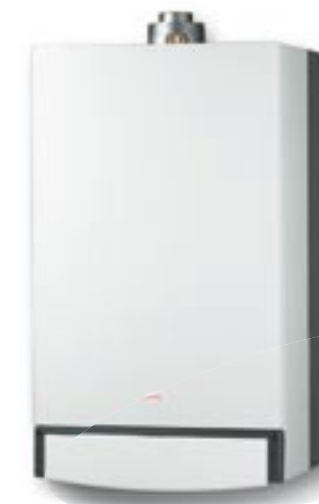
Model LUNA Fi